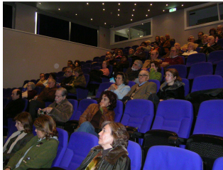
Um aspecto da assistência