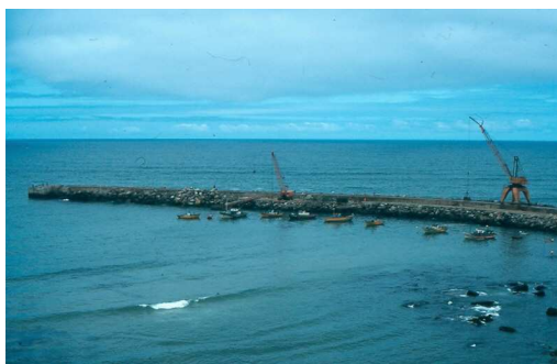
Meados dos anos 80: Obras no molhe.

1964 - É começada a obra de varadouro cimentado, para estacionar os barcos em seco e que foi concluída em 1966.